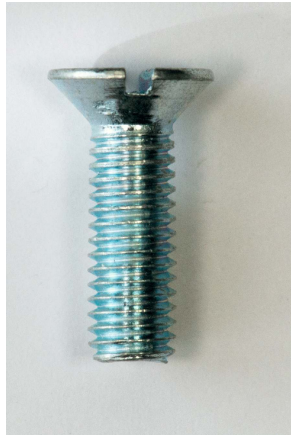
verzonken kop met gleuf