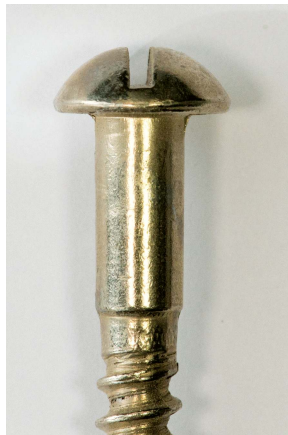
bolkop met gleuf