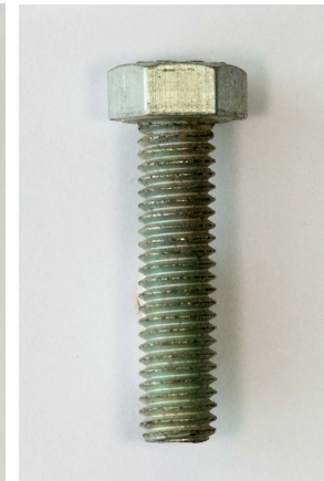
uitwendig zeskant (bout)