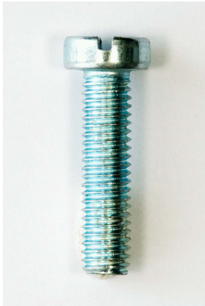
cilinderkop (CK) met gleuf