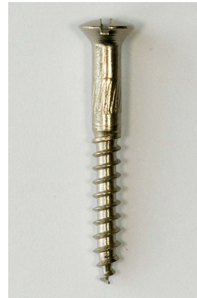
lenskop met gleuf